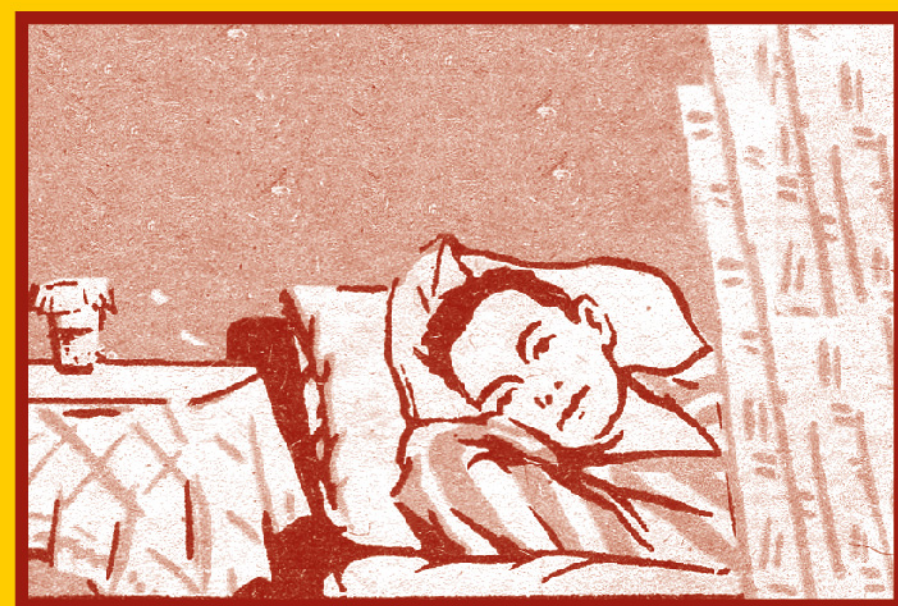
Избегайте контактов с заболевшими