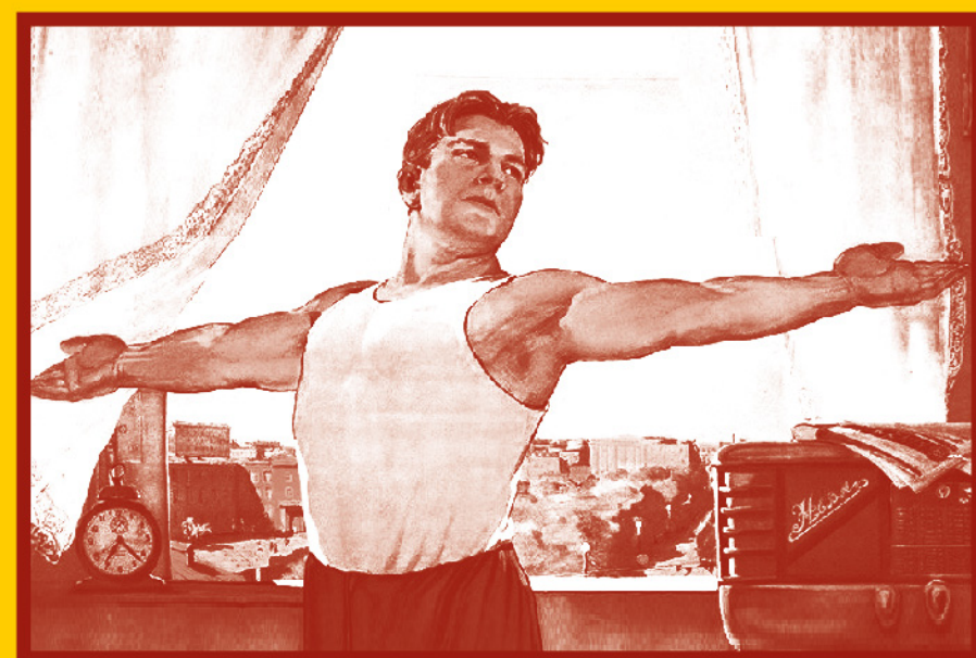
Ведите здоровый образ жизни