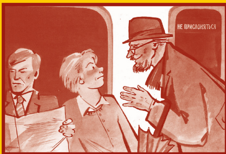
Ограничьте пребывание в местах скопления людей