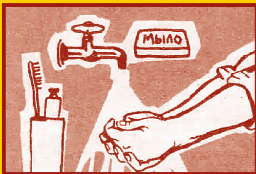
Регулярно мойте руки