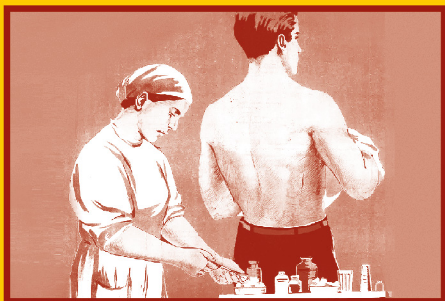
Сделайте прививку от гриппа